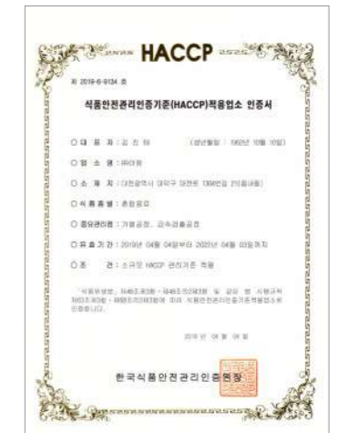
HACCP (Mixed beverage)