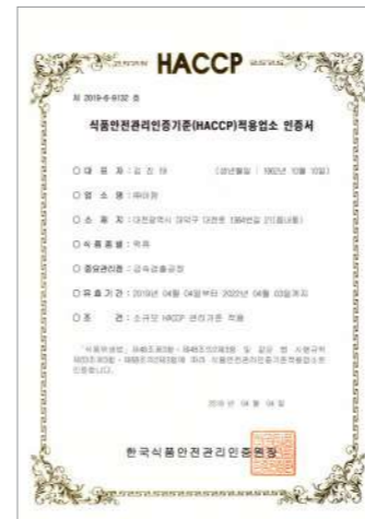
HACCP (Rice Cakes)

Sản phẩm được sản xuất tại cơ sở chế biến sạch sẽ và hợp vệ sinh. Chúng tôi luôn nỗ lực hết mình để mang đến sản phẩm chất lượng và an toàn thông qua quy trình kiểm tra nghiêm ngặt từ khâu nguyên liệu đầu vào đến khâu đóng gói thành phẩm.