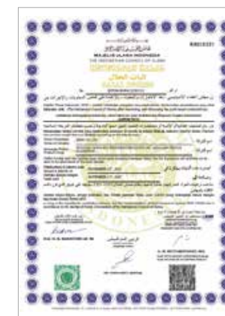
MUI HALAL (餅類, 飲料)